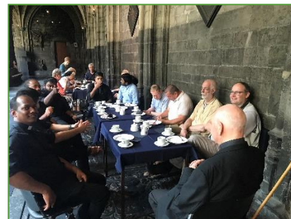
Einde van het werkjaar werd afgesloten in de OLVrouwekerk met een gezellig samenzijn.